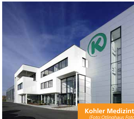
Kohler Medizintechnik, Stockach

So ist die Freude auch heute noch immer groß, wenn das Architekturbüro Weber Audits mit sehr guten Resultaten erhält. „Ganz besonders erfreut waren wir über unser Erstaudit, das sehr positiv ausgefallen ist“, so Weber. Insgesamt ist der Architekt also mehr als zufrieden mit dem Qualitätsstandard Planer am Bau, auch wenn es passieren kann, dass er kurz aufstöhnt, wenn ihn an einem stressigen Tag die Erinnerung an die pünktliche Abgabe z.B. der jährlichen Selbstbewertung erreicht.