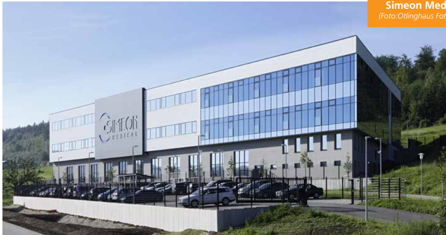
Simeon Medical, Tuttlingen